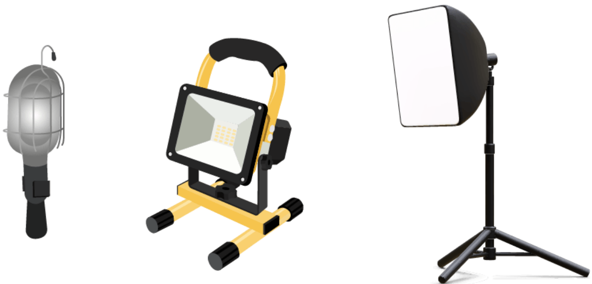
Figura 1.2.1.1. i. Ejemplos de luminaria portátil.

Se consideran como luminarias portátiles las luminarias para montaje en pared equipadas con un cable flexible, fijado de forma permanente para conexión a una clavija, luminarias fijadas a su soporte por medio de una tuerca de mariposa o de una pinza o de un gancho de manera que puedan ser fácilmente quitadas de su soporte con la mano.