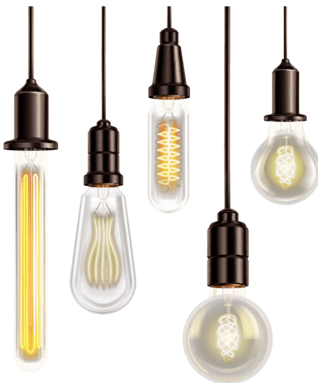
Figura 1.2.1.1. b. Ejemplos de bombillas de estado sólido decorativas.

Bombilla de estado sólido decorativa: Toda fuente luminosa diseñada para brindar un atractivo visual, generar las condiciones para resaltar un objeto o espacio puntual, con propósitos distintos a los de proporcionar visibilidad a una tarea visual humana. Incluye bombillas vintage, bombillas RGB, RGBA, RGBW, bombillas inteligentes para uso decorativo, bombillas con panel solar integrado, entre otros que presenten características similares. Pueden estar provistas de elementos para su control y conexión a la fuente de alimentación. Se incluyen las bombillas decorativas provistas con conectores USB para alimentación y/o control.