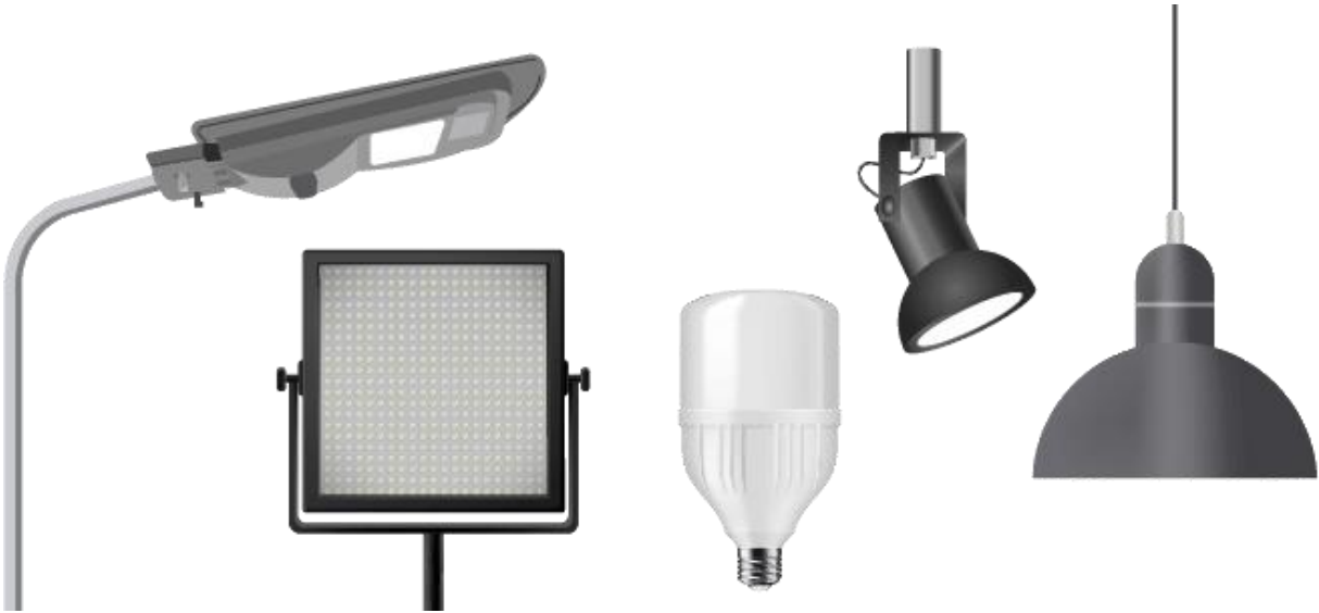
Figura 1.2.1.1. f. Ejemplos de luminarias.

“Por la cual se modifica el Reglamento Técnico de Iluminación y Alumbrado Público - RETILAP”