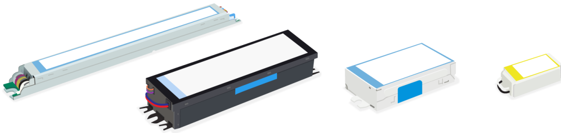
Figura 1.2.1.1. a. Ejemplos de balastos electrónicos.

Balasto electrónico: Dispositivos estabilizadores destinados a la alimentación de una o varias bombillas. También puede ser construido para reemplazar balastos electromagnéticos en sistemas de descarga.