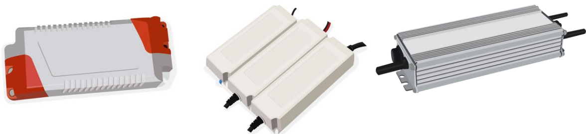
Figura 1.2.1.1. d. Ejemplos de Drivers para fuentes luminosas LED.

Driver (Equipo de alimentación y/o control o Controlgear): Fuente de alimentación eléctrica o electrónica, o equipo de control LED ( controlgear for LED module; LED controlgear ). El cual se encuentra entre la alimentación eléctrica y uno o más módulos LED que sirve para la alimentación de estos dispositivos a su tensión o corriente nominal y que puede consistir en una o más partes separadas; puede incluir medios para la regulación de niveles de luz emitida, corrección del factor de potencia y la supresión de radio interferencias, además de otras funciones de control. El equipo puede consistir en una fuente de alimentación y en una unidad de control, o puede estar integrado total o parcialmente con el módulo o módulos LED.