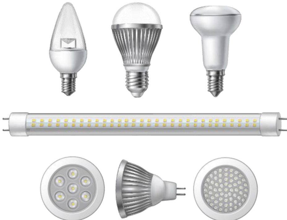
Figura 1.2.1.1. e. Ejemplos de fuente luminosa integrada LED.

Fuente luminosa integrada: Bombilla eléctrica (fuente luminosa) que no se puede desmontar sin sufrir daños permanentes, que puede incorporar equipo de control y todos los elementos adicionales necesarios para el arranque y funcionamiento estable de la fuente de luz, diseñada para conexión directa a la tensión de alimentación.