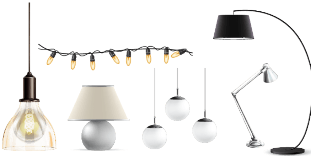
Figura 1.2.1.1. g. Ejemplo de luminaria decorativa.

Las luminarias decorativas pueden estar provistas de elementos para su control y conexión a la fuente de alimentación. Incluyen a los productos de iluminación decorativa provistos con conectores USB para alimentación y/o control.