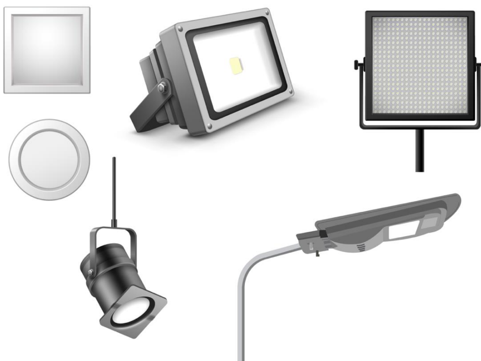
Figura 1.2.1.1. h. Ejemplos de luminarias LED.

Luminaria LED: Luminaria que incorpora una o más fuentes de luz LED.