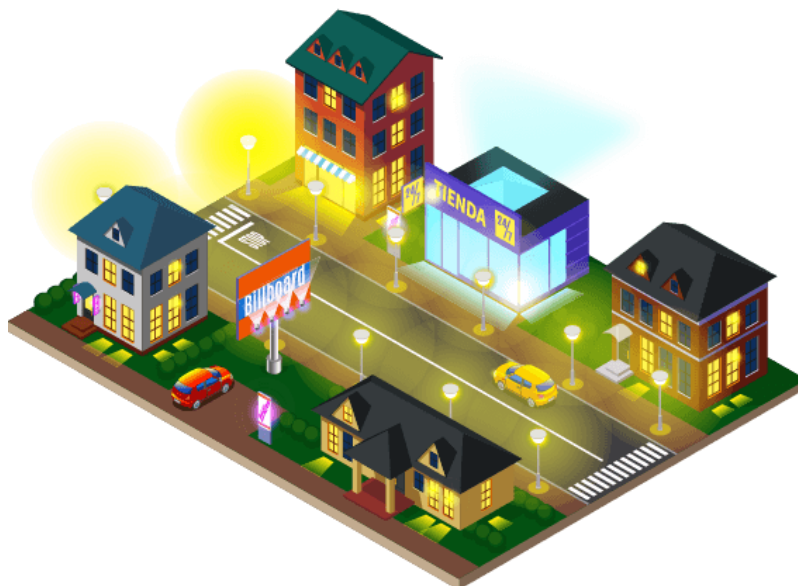
Figura 1.2.1.1. c. Contaminación lumínica.

Contaminación lumínica: Conjunto de todos los efectos adversos de la luz artificial que influyen en la atmosfera y que generan disminución de la percepción visual astronómica.